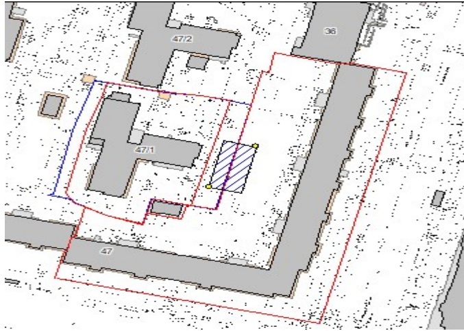
Схема размещения спортивной площадки на придомовой территории, расположенной по адресу: ул. Мелик-Карамова, 47-47/1