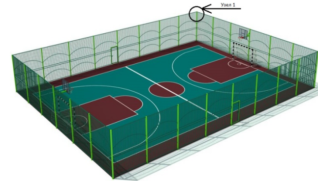
3D модель спортивной площадки